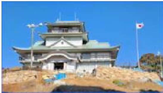
小牧山歴史館(小牧山城)